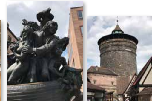
„Stadtführung inklusive“ in der Nachbarstadt Nürnberg für die LV-Mitglieder.