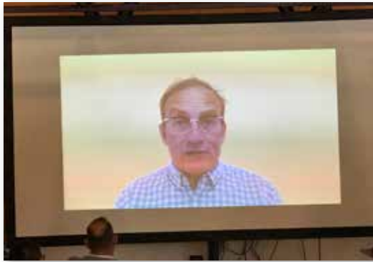
Begrüßung per Video: Wiegald Boning, prominenter Komiker in ernsthafter Rolle – als Schirmherr von Dravet-Syndrom e. V.